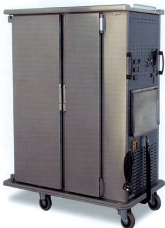
Gemini 30 HR