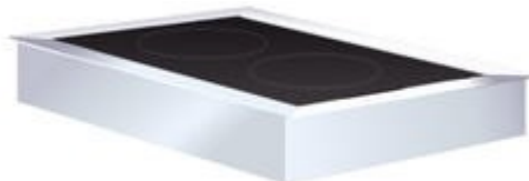
Placas quentes em vitro-cerâmica para diferentes temperaturas